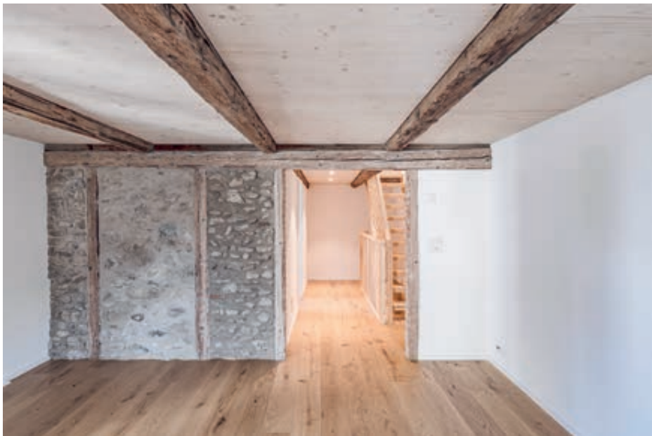
Grosse Teile der historischen Tragkonstruktion blieben erhalten.

Mit viel Engagement und Geduld seitens Bauherrschaft wurde das Gebäude nach dem kontrollierten Rückbau in enger Zusammenarbeit mit den städtischen Stellen und