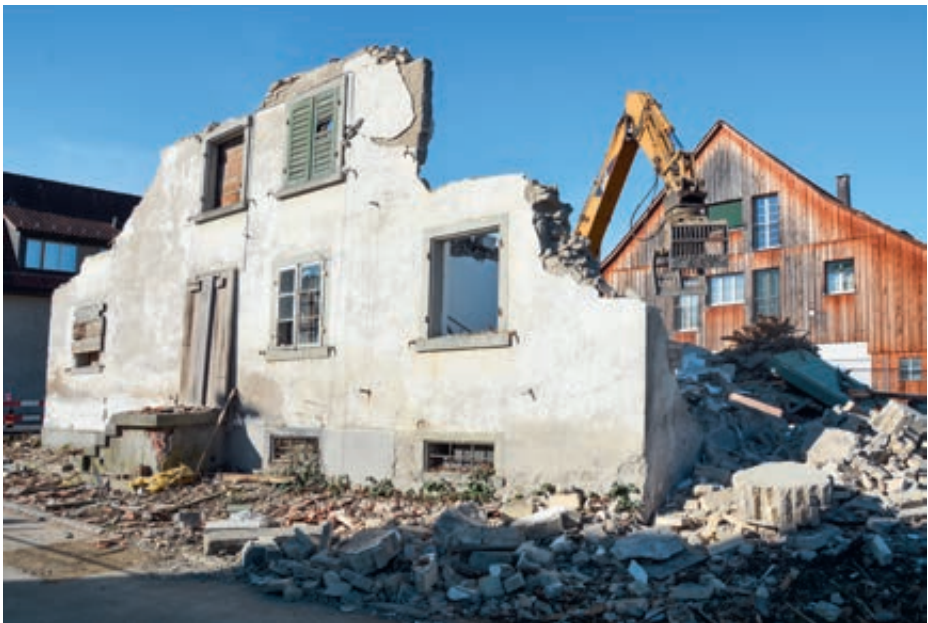
Im Winter 2016 liess der Stadtrat das Gebäude zurückbauen, um dem Einsturz zuvorzukommen.

Der Rückbau und die Brache haben zu vielen Diskussionen in der Bevölkerung, aber auch mit dem Zürcher Heimatschutz geführt. Nach der Übernahme der Liegenschaft