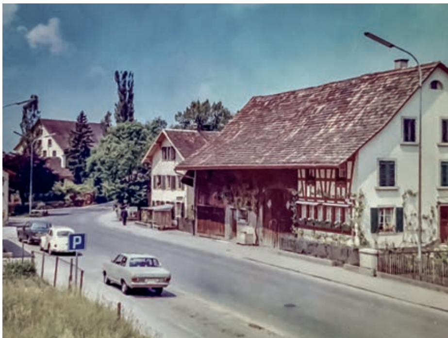
Historisches Foto der Liegenschaft Wallisellenstrasse 28, im Hintergrund das Gebäude der 1836 erbauten Spinnerei Hanhart, bekannt als Memphis-Gebäude, abgebrochen 2003.

1977 hat Herbert Rieser das «Stall-Lädeli» mit Ruedi Feurer im Stall des Gebäudes an der Wallisellenstrasse 24 eröffnet, bevor sie in die Wallisellenstrasse 28 umzogen.